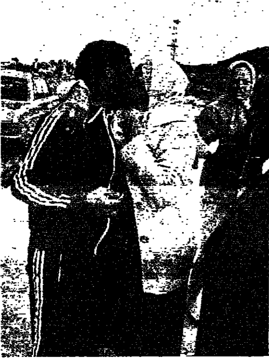
لقاء المعتقلين مع توبهم

الساعة الثانية بعد الظهر، انطلق بالباصات من الشرفية مرورا بطنينية وحتى حاجز الجيش اللبناني عند بلدة زقا، حين انقطع الاوف من المواطنين من كل الاعمار نحو الاوتوبيسات واتزاولوا العديد من المفرج عنهم وهم يصرخون، الله اكبر الله اكبر، وهم يصرخون، الله اكبر الله اكبر.